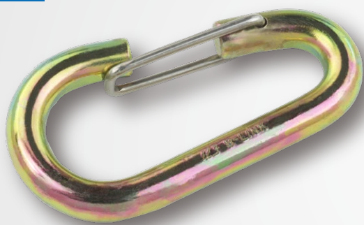
※写真は8ミリを使用