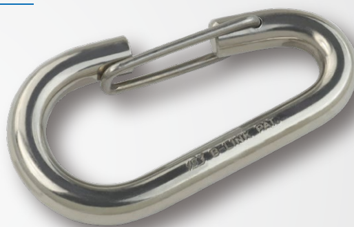
※写真は8ミリを使用