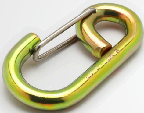
※写真は8ミリを使用