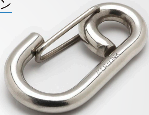
※写真は8ミリを使用