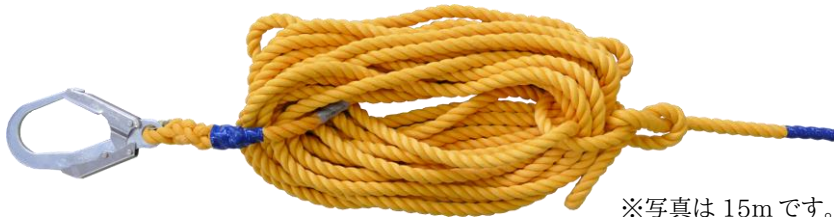
※写真は 15m です。